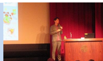
昨年度のフォーラムの様子