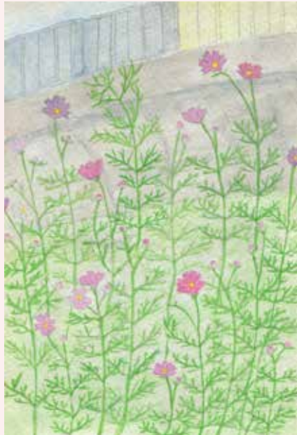
金賞 「風にゆれるコスモス」 とくら 十倉ゆず 場所 / 小泉川付近

■この景観を描いた理由： 高速道路と昔から伝わる、端午の節句の“こいのぼり”の調和と“こいのぼり”の表情を描きました。