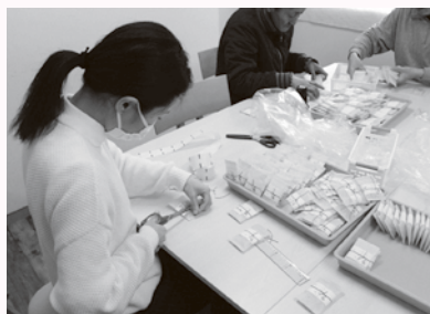
やよい工房久貝事業所では、約40人が内職などの作業に従事しています

今後、障がいについて共に学ぶ学習会や、ワークショップも行う予定です。詳細が決まり次第、本紙でもお知らせしますので、ぜひご参加ください。