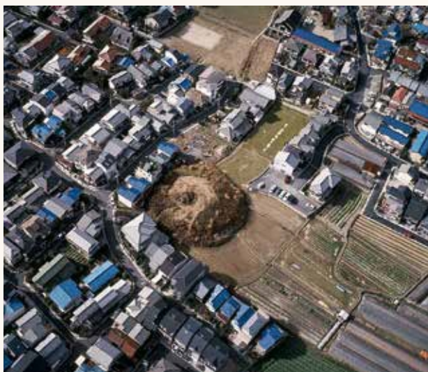
▲上空からみた整備前の今里大塚古墳(北西から)