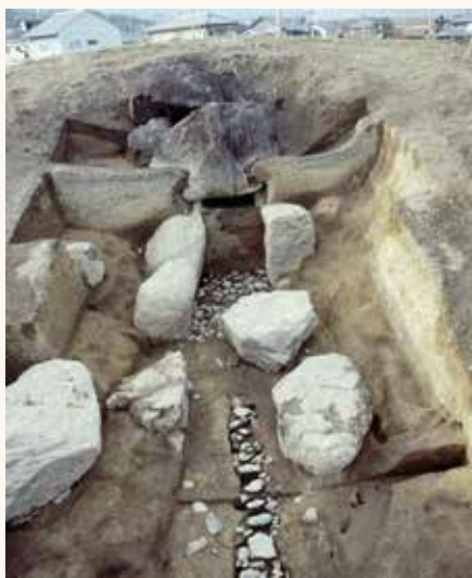
▲今里大塚古墳の石室(南東から)