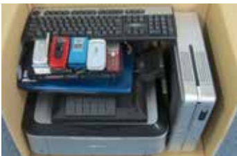
小型家電は、金が見る「都市鉱山」

日本で広く普及しているパソコンや携帯電話などの小型家電。実はこれらには金などの貴重な資源が含まれており、「都市鉱山」と呼ばれています。日本は、世界の埋蔵量に対して金が16.36%、タンタル(レアメタル)が10.41%と推計されています。この貴重な資源を効率的に回収するために、市では、平成27年度から国の認定事業者であるリネットジャパン(株)と