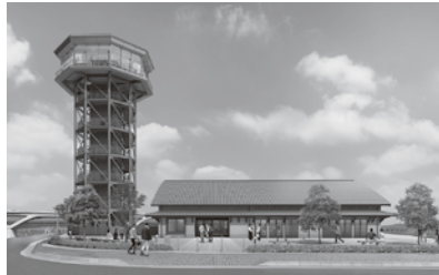
⑧商工観光課観光戦略・地域経済推進担当 ☎955-9515 FAX951-5410

淀川三川合流域の地域振興や周遊促進の拠点となる国営公園のサービスセンターとして、八幡市の淀川河川公園背割堤地区にオープンします。地域振興プログラムや室内での学習会、自転車利用者の休憩など、多目的に使えるサービスセンター棟と、地上約25mの高さから1.4kmの桜並木を一望できる展望塔を備え、誰でも利用できます。