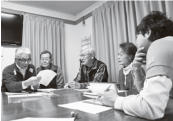
具体案を一緒に考えます

そこで提案したのが、これまで培ってきた経験や知恵を詰め込んだマニュアルを作ることに。パトロールの隊長さんを中心に、関係機関とも協力して、地域ぐるみで作成に取り組みました。