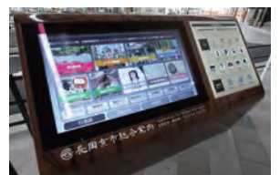
UD配慮の総合案内装置

UDは、あらゆる角度から、使いやすさに配慮して製作されます。このように多様性を認識し誰もが暮らしやすい、UDのまちづくりが求められています。