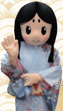
ガラシャ祭 マスコットキャラクター 「お玉ちゃん」