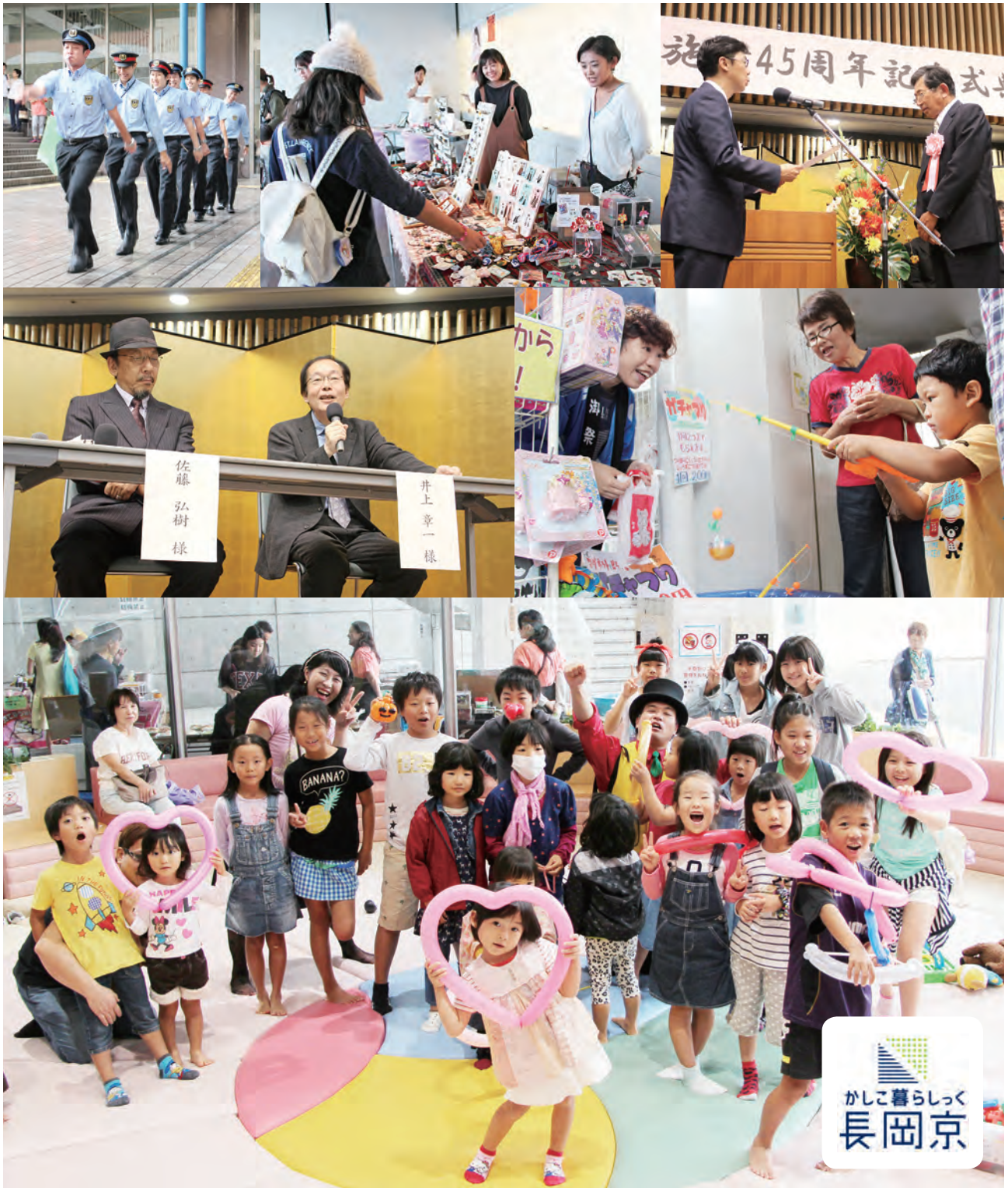
長岡京市45周年おめでとう。「市制施行45周年記念式典」と「ママキッズまるごとマルシェ in かしこ暮らしっく長岡京」（9月16日、バンビオで）