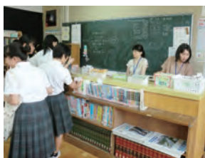
右 部活動での支援 上 図書ボランティア