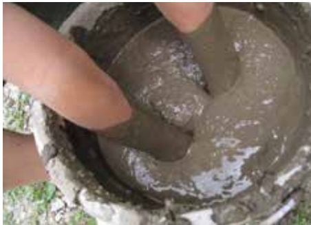
バケツ稲に挑戦！ちゃんと育つかな。

とができました。そして何より、お米はもつと大切に食べなければいけないんだと思いました。この記事を読んでいる人も、お米に対しての思いを見直し、大切に、感謝してお米を食べるようにしましょう。