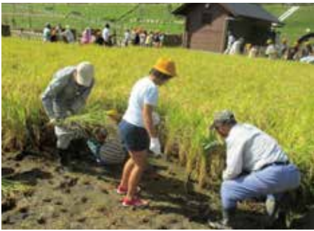
稲刈りの仕方を教えてもらいました。

このように私たちが普段何気なく食べているお米には、たくさんのお米の苦労と思いが込められていることが分かりました。また自分たちで体験することで、より農家さんの苦労に気がつくこ