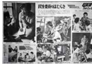
いつの時代も人々に寄り添って...

しかし、いつの時代でも変わらないもの もあります。それは、人々が直面する 問題を発見し、「何とかせねば」と課題 に向き合い寄り添ってきたこと。その人 の幸せな暮らしを守るため に、さまざまな支援の窓口 に思いをつなぎ「一歩踏み 出す」主体的な活動を続けて きたこと。