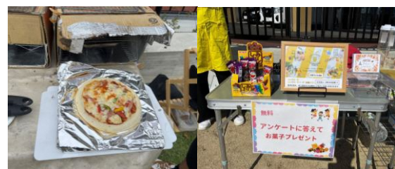
段ボール窯のピザづくり体験など