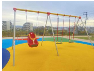
ブランコ(サポート付き)