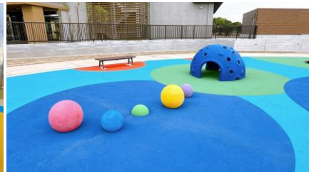
ゴムボール・隠れ家(ドーム)