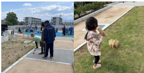
ポッチャ・モルック体験

本公園では、ポッチャやモルック体験、段ボール窯を用いたピザづくり体験などの活動を通じて、遊びのきっかけづくりや見守りを行っています。これにより、年齢や特性の異なる子どもや保護者が安心して交流できる場が生まれ、公園の魅力向上につながっています。