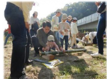
○市民と市民団体との連携・協働 西山森林整備推進協議会による自然体験型イベント