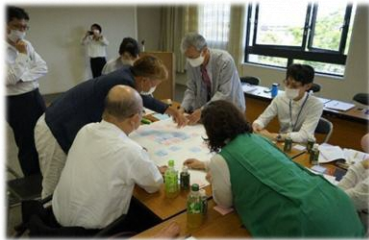
○市民と行政との連携・協働 西山公園のインクルーシブ公園整備に向けたワークショップ

本市では、施策の推進にあたり、関係主体が共通の目標を共有し、連携して取り組める協働の体制整備を図ります。