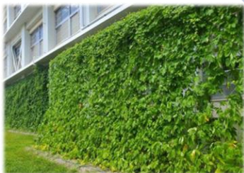
○教育・研究機関との連携・協働 グリーンカーテンづくりによる環境教育