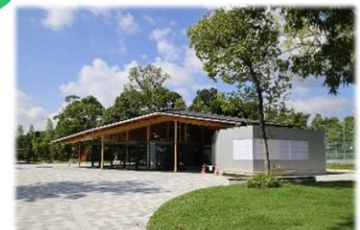
○事業者と行政との連携・協働 地域企業の協力による長岡公園の再整備