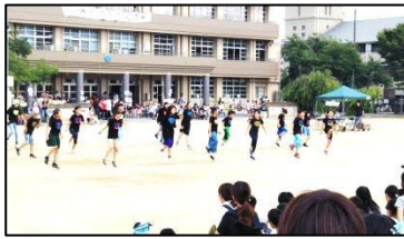
華やかなオープニング

子どもたちが楽しみにしている夏休み。夏休みにはそれぞれにいろいろな体験が待っていると思いますが、地域の方々や保護者・先生方が、子どもたちに“夏の楽しい思い出を”と準備され、多くの小学校区で、それぞれ趣向を凝らした夏まつりが開催されました。中学校吹奏楽部の演奏や児童によるヒップホップダンスのパフォーマンス、竹ろうそくを灯して6年生が夢を語るなどオープニングが華やかに飾られ、子どもたちは、いろいろな遊びのコーナーを回って遊んだり、模擬店が出店されている会場では、フランクフルトや唐揚げ・かき氷などを食べたりして楽しみました。また、エンディングには、長岡京音頭をみんなで踊ったり、空一面に咲く花火を楽しんだりする（天候により花火は延期の会場もありましたが）など、限られた時間の中で、楽しいひと時を過ごしました。「地域総がかり」での夏まつり。子どもたちは、当日までの諸準備から当日の運営・進行までお世話になった地域の方々への感謝の気持ちと楽しい思い出をたくさんもって家路に就きました。