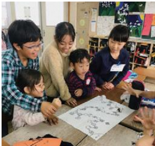
手作りすごろくと一緒に遊びました