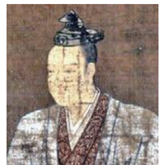
明智光秀肖像（本徳寺所蔵）

2020年の大河ドラマは、明智光秀を主人公にした「麒麟がくる」です。光秀をはじめ、長岡京市にゆかりの人物が多く登場しそうです。本シリーズでは、ドラマ放映に向けて、戦国時代に本市に足跡を残した人々を全8回で紹介します。「麒麟」とは、中国に伝わる、善政を行う王の元に現れる空想上の動物です。