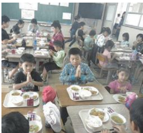
「いただきます」をして楽しく給食を食べました