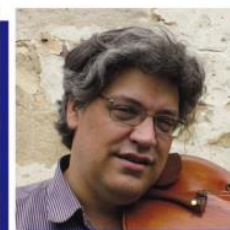
Va デヴィッド・キグル