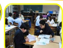
長二中テスト前学習会