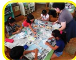
長八小 パステルアート体験