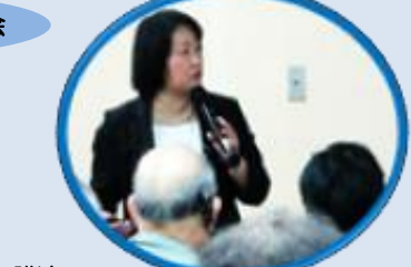
講演 「スマホ時代の子ども達に大人ができること」