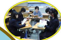
地域で支える中学校教育支援事業