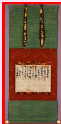
長十小発掘調査時「第国」墨書土器