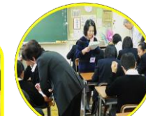
長四中7校時学習会(英語)