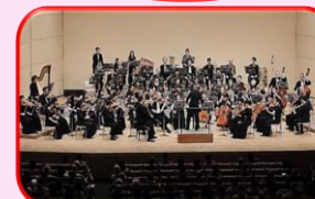
国文祭記念コンサート