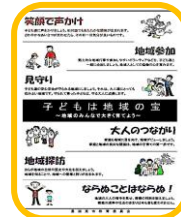
地域の子育て支援啓発紙