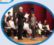
優秀賞受賞者表彰式