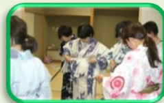
ゆかたの着付けとヘアアレンジを学びましょう