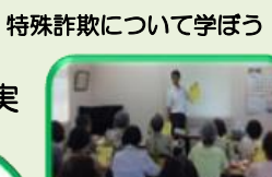
特殊詐欺について学ぼう