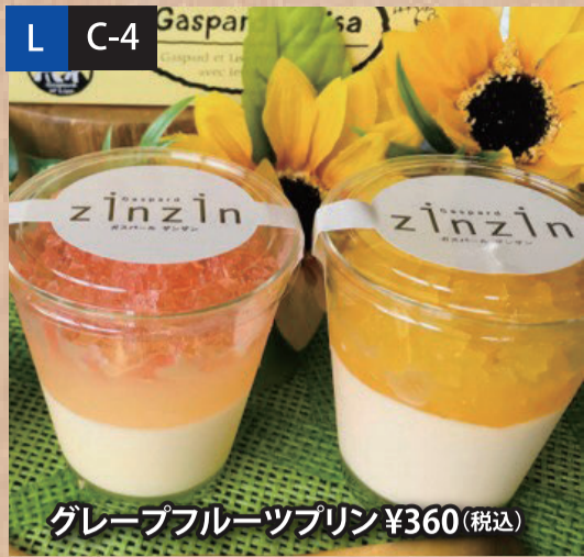
グレープフルーツプリン ¥360(税込)