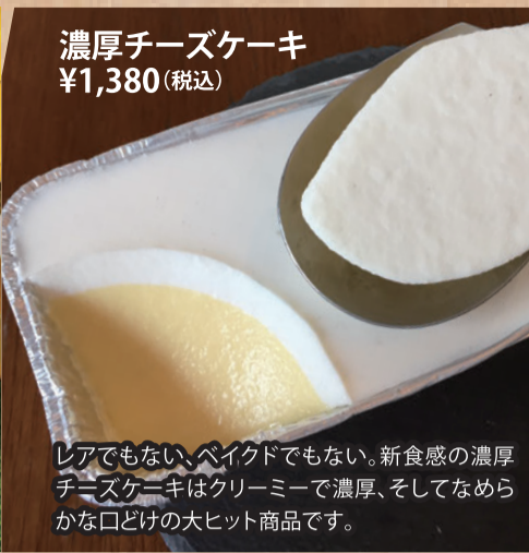
濃厚チーズケーキ ¥1,380(税込)

レアでもない、ベイクドでもない。新食感の濃厚チーズケーキはクリーミーで濃厚、そしてなめらかな口どけの大ヒット商品です。