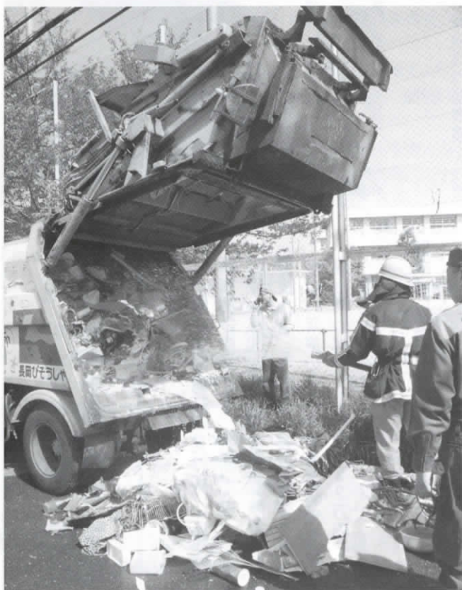
▲分別を守っていただければこんなことには… (4月22日、長四小南側の道路で)