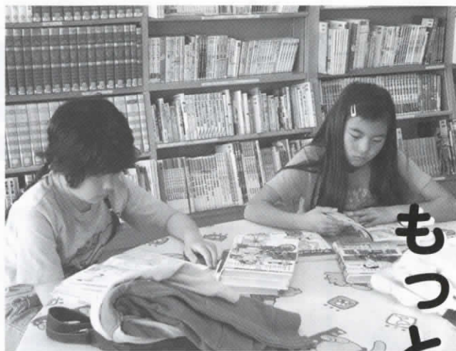
図書館で借りた本の返却が便利に