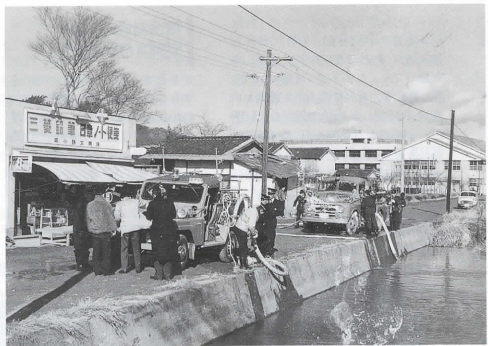
▲昭和30年代中ごろ撮影。当時、長岡中学校の前には どの 澱ヶ池と小池があり、その水を使って出初め式が行われていました。現在は、小池を少し残すだけで図書館や中央公民館などが並ぶ文化センターになっています。