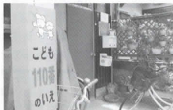
▲どこにあるか確認してね