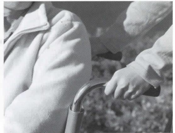
介護保険— みんなで支え合う社会づくり

■歳入(収入) 平成15年度に保険料の基準額を月額3454円に改定したことから、介護保険料の収入は増加し、5億7444万円(前年比2・9%増)となりました。