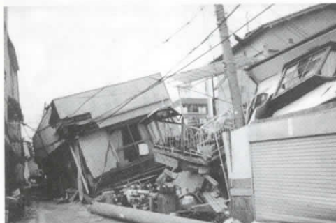
地震で倒壊した家屋 (写真は本市とは関係ありません)