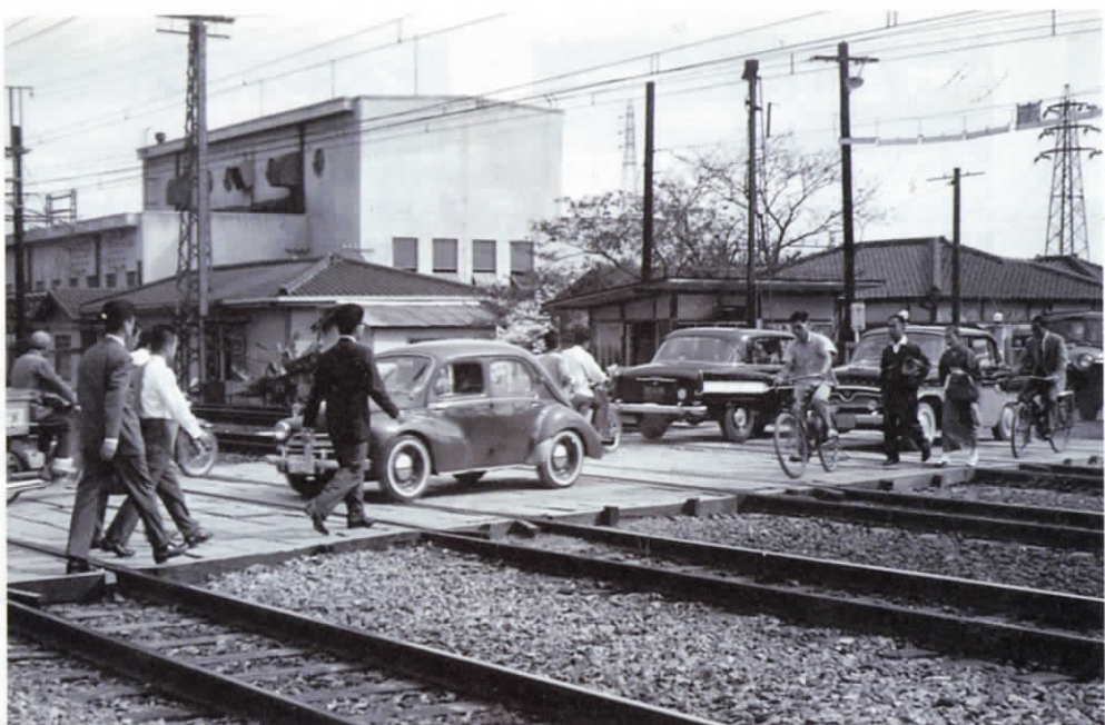
▲昭和36(1961)年ごろ撮影。国鉄神足駅(現在のJR長岡京駅)北側には踏切があり、多くの人や車が往来していました。しかし近くに迂回路ができたため、昭和44年(1969)に踏切はなくなり、代わりに地下歩道が整備されました。