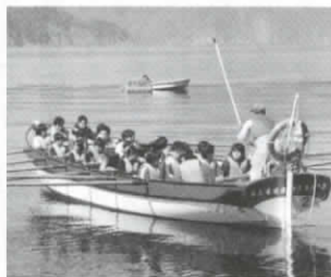
海の上でカッターボート体験