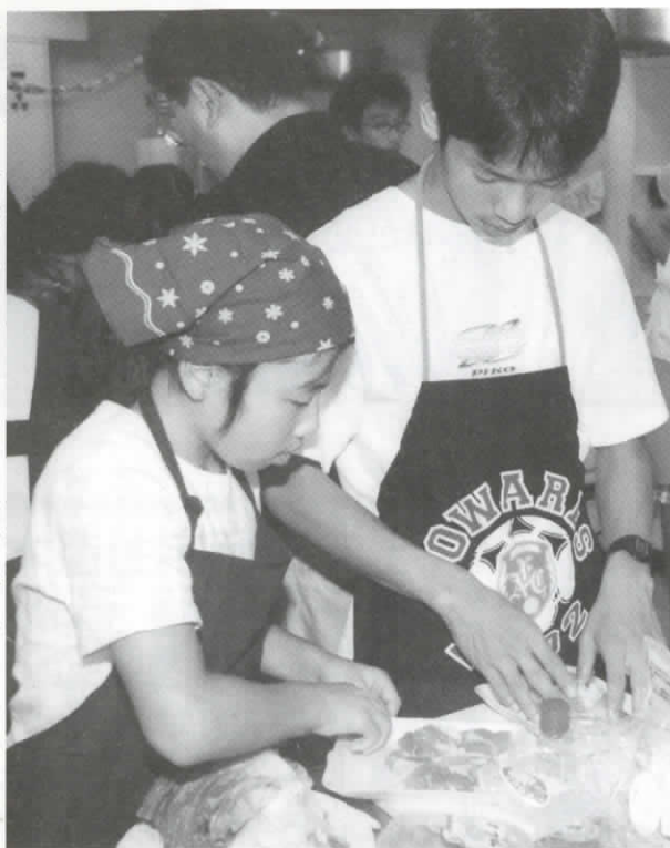
協力し合って料理作り。自分たちで作った料理の味は格別！