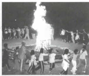
夜はやっぱりキャンプファイヤー

未来を担う子どもたちにとって、自主性や協調性を身につけていくことは大切です。ここでの体験や出会った仲間、何ものにも変えられない宝物となり、社会人になってからも貴重な財産として残るはずです。