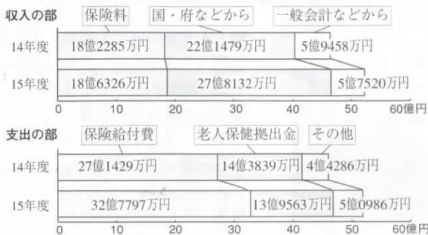
●国民健康保険事業の決算額（平成14・15年度）