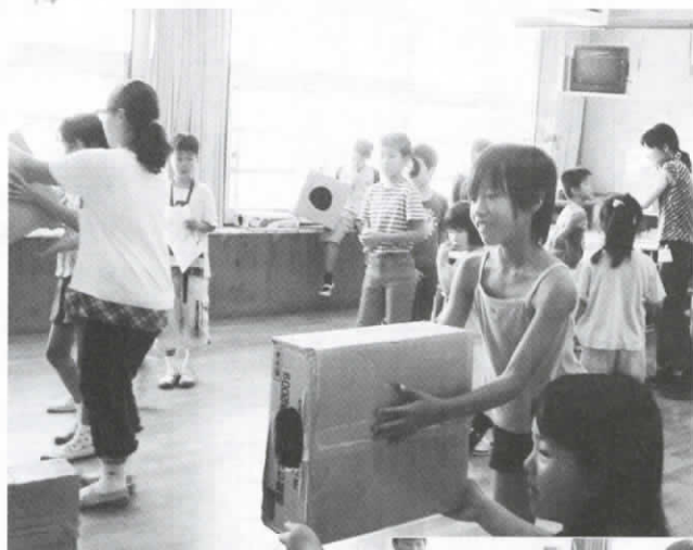
▲空気砲ストラック。