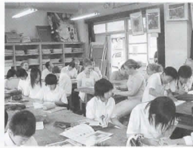
▲長三中で美術の授業

7月には、アーリントンから中高生10人を含む総勢14人が来日しました。8日と11日の両日、長三中と一緒に授業や部活動に参加し、交流を深めました。 この様子は、新聞にも載りました。短い時間でしたが、楽しい時間を共に過ごすことができました。