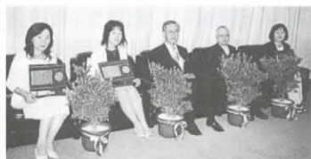
▲きりしま賞を受賞されたみなさん

7月20日、中央公民館市民ホールで、長岡京市社会福祉大会を行いました。「夢と希望が持てる福祉のまち」を目指して、市と(福)社会福祉協議会が毎年開催しています。福祉活動の功労者として、右のみなさんが受賞されました。(順不同)