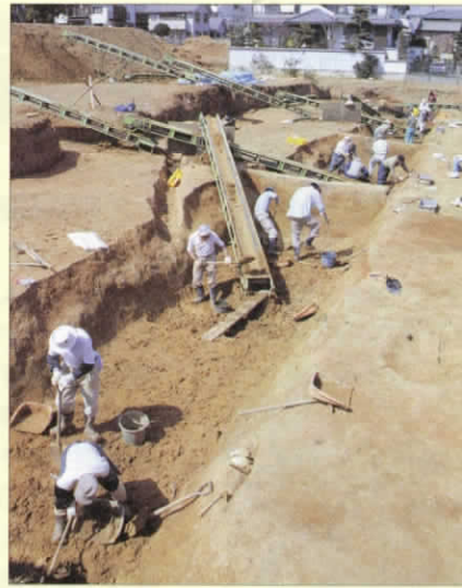
▲大規模な溝跡を掘る