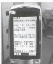
▲8月17日に配信された地震の内容を表示したメール

京都府は、地域社会で人々が安全・安心に暮らせるよう、気象情報や災害情報、犯罪の発生情報などを電子メールで携帯電話にお知らせする「防災・防犯情報メール」を配信しています。