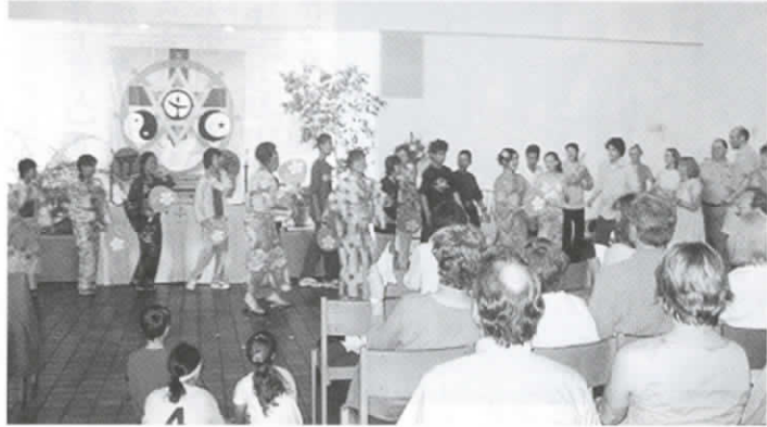
▲一緒に踊りましょう (米国・アーリントンで)

長岡第三中学校は今年、創立30周年。その記念事業の一つとして、2年生12人と3年生8人が6月8日から10日間、長岡京市の姉妹都市である、米国マサチューセッツ州アーリントンタウンを訪問しました。