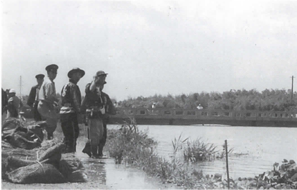
▲道路上に土嚢を積み警戒にあたる（昭和34年8月、小畑川落合橋付近）