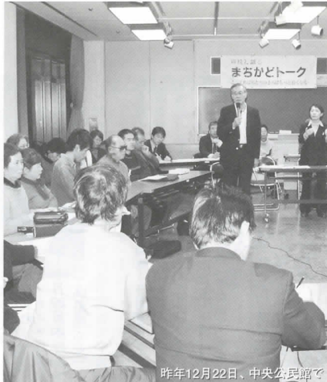
昨年12月22日、中央公民館で

昨年度の「まちかどトーク」は、開催方法をこれまでの校区別から分野別に変えて、各分野で活躍されている団体の方々に公募市民の方々と交えて実施しました。延べ200人近くの人が参加し、市長と膝を交えて語り合いました。その一部を抜粋し、Q&A(質問や意見と、答え)の形でお知らせします。