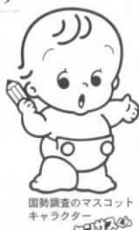
国勢調査のマスコットキャラクター

http://www.stat.go.jp/data/kokusei/2005/kouhou/