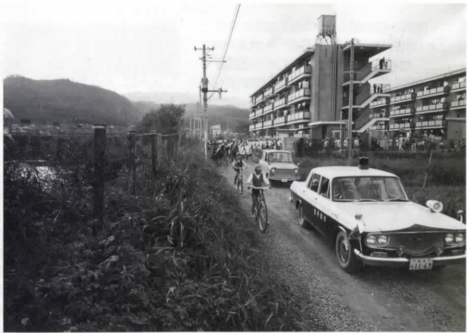
▲昭和43(1968)年10月に撮影。長三小校区防犯パトロールの風景です。地域の人たちが一団となって見回る姿が写っています。当時は狭く舗装もされていなかった道は、今は拡幅され、路線バスも通る幹線道となっています。