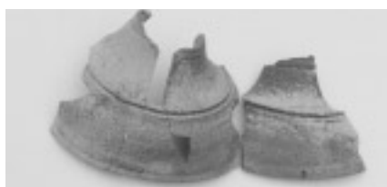
▲▶私たちが発見したつぼのかげら ㊤と石棺のかげら㊦