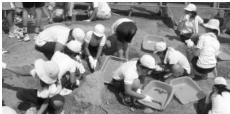
▲発掘体験にみんなワクワク