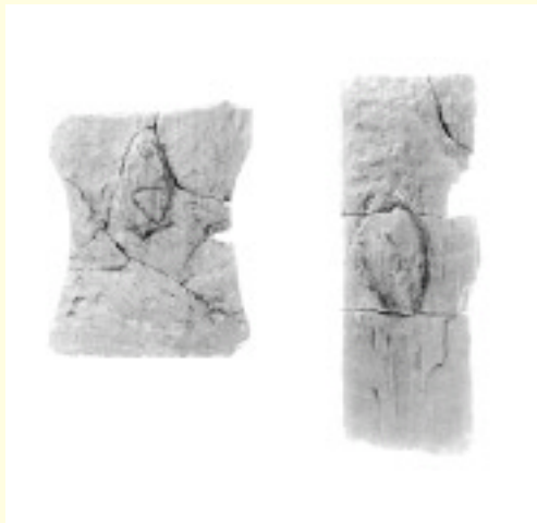
▲環濠から出土した鍬

このような遺物から、乙訓に初めて営まれた弥生ムラの人たちは、水稲農耕 すいとう に欠かせない道具の作り方や使い方、水田構築の知識とその管理や運営に必要な組織などを知っていたことがわかります。（財長岡京市埋蔵文化財センター）