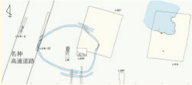
▲雲宮遺跡の弥生時代前期のムラ

雲宮弥生前期ムラの中心部は、東西約110メートル、南北約80メートルの楕円形で、面積は、およそ7100平方メートルと推定されます。また、その周囲