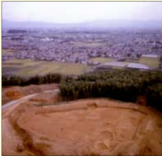
谷山遺跡から北西を望む風景

を上げる役割を担った村が高地性集落ではないかと考えられています。谷山遺跡は、向日神社で見つかっている北山遺跡や、周辺部の高地性集落と連絡を取り合うことにより、裾野の村をはじめ、乙訓地域の政治的緊張の不安を解きほぐす、重要な任務を担っていたのではないかと考えられます。