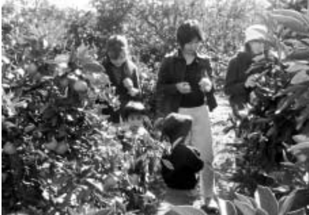
たわわに実ったみかんが、緑葉の間からこぼれるように顔を出しています。「甘くておいしいね」。もぎたての果実をほおぼりながら、親子連れが秋の一日を楽しんでいました。(11月18日、奥海印寺の観光農園で)