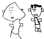
絵: 乙訓学園利用者