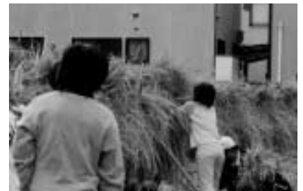
こんなにたくさん刈ったよ!

みんな「ザックザック」と刈っていました。結んでたばねるのにたいへん苦労しました。人もいました。また、稲を刈っていると、パツタやかえるなどの生き物がたくさん出てきました。作業は約1時間かかりました。その