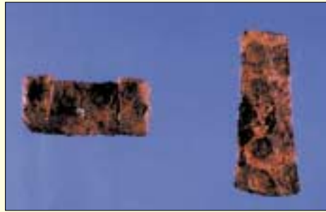
谷山遺跡から出土した鉄器