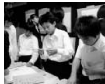
制作展では興味しんしん！

一人ひとり が、文化祭 を成功させ るために一 つになり、 友情と団結 を深めると てもいい機 会になった と思いまし た。 特に3年 生は、最後 の文化祭だ けあって、 練習にも拍 車がかか り、毎日下 校時間まで 残ったり、