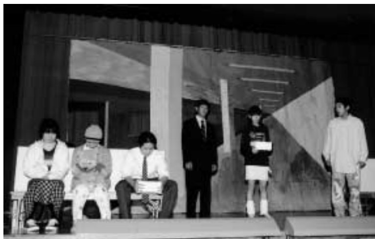
練習の成果を発表する生徒たち

長岡第四中学校では、10月23日・24日に文化祭がありました。 発表の内容は、学年ごとに違い、1年生は、自分たちの教室に製作物などを展示。2年生は、和太鼓、ミュージカル、自主制作映画などの舞台発表を、3年生は、演劇をしました。生徒