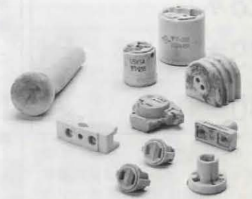
▲コンセントやソケットなど