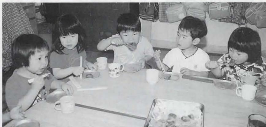
▲散歩で摘んだよもぎを入れて、みんなでよもぎ団子を作りました。とてもおいしかったので、団子はあつという間にみんなのおなかの中に入れてしまいました。(5月10日 開田保育所)