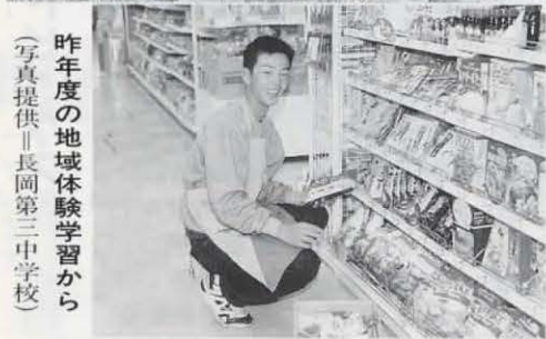
昨年度の地域体験学習から

中学生の地域体験学習 心身とも大きく成長する時期にある中学生。地域の中で、様々な職場体験や農作業、ボランティア、文化・創作活動などを体験することは、自分を見つめ直し、生き方を考えるきっかけになります。 市では「心の教育」推進のため、全ての中学校で「地域体験学習」を実施します。体