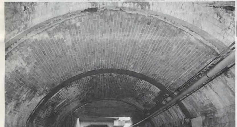
▲アーチの内部は頑強なれんが造り。当節のトンネル壁落下事故のような気配は全くありません