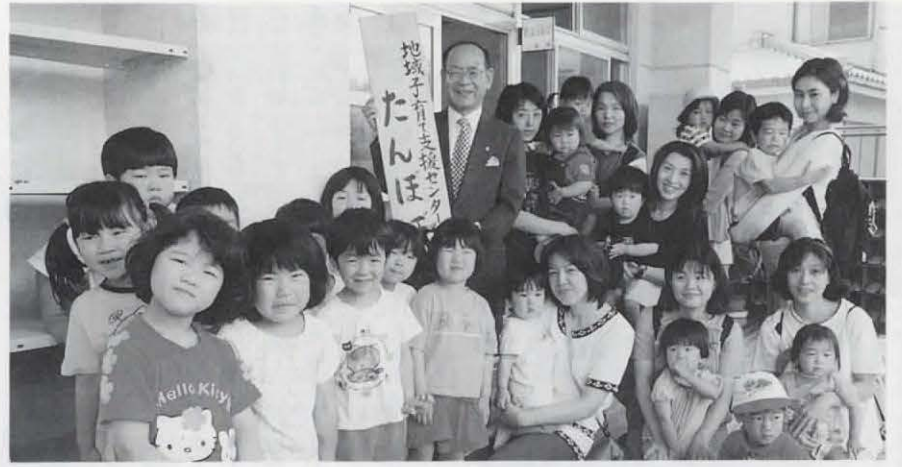
▲深田保育所内の地域子育て支援センター「たんぼぼ」の開所式が行われました。市内では、「エンゼル」に次ぐ二番目。子育て相談や遊びの広場、子育てサロン、子育てサークル育成、子育て講座など、いきいき子育てを応援します。(5月26日 深田保育所)