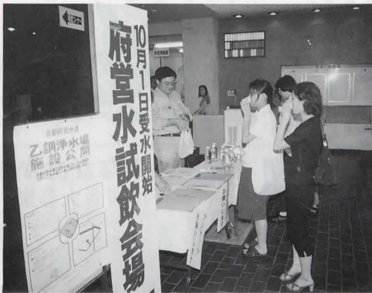
▶10月1日から受水される府営水の試飲会が行われました。「そんなに味はわからない」「思ったよりおいしい」などの意見がでていました。(9月4日 市役所ロビー前)