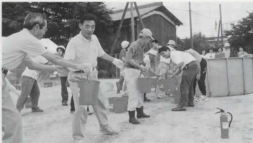
▲長岡第五小学校区の自主防災会や自治会、消防団、警察署、消防本部などが参加して、バケツリレーや消火器による消火訓練や防災資機材を使った救出訓練など市民の参加・体験型の防災訓練が行われました。(9月3日 長岡第五小学校グラウンド)