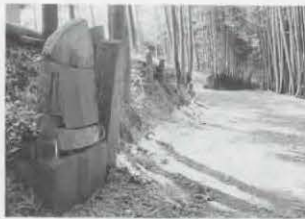
竹林にたたずむ(十六丁地蔵)