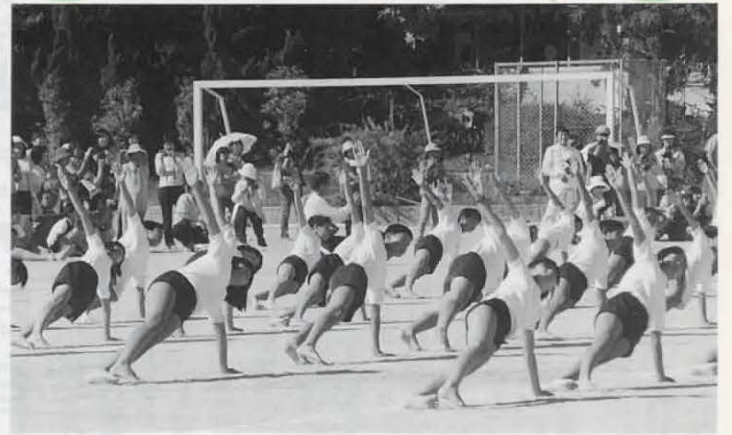
▲練習の成果を発揮、6年生の組体操では息のあった演技が繰り広げられ、観客席からも大きな拍手が贈られていました。(9月27日 長岡第五小学校)