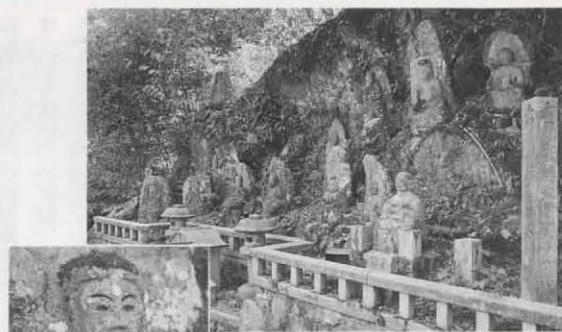
崖にならぶ弥勒谷十三仏 顔には風雪にたえた歳月が刻まれ...