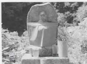
水や草花の供えが(九丁地蔵)