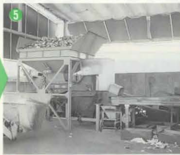
⑤収集したビンなどを選別します