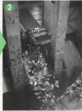
②収集したごみを乙訓環境衛生組合のごみピットへ ③1号焼却炉と中の様子。850°~900°で焼却します