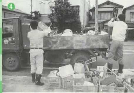
④分別収集ステーションでの作業

減らないごみ・減らしたいごみ、市民の皆さんはごみについて、どのようになら考えているのでしょうか。家庭で実践できる、ごみを減らすためのアイデアや問題などを、皆さんと一緒に考えていきましょう。