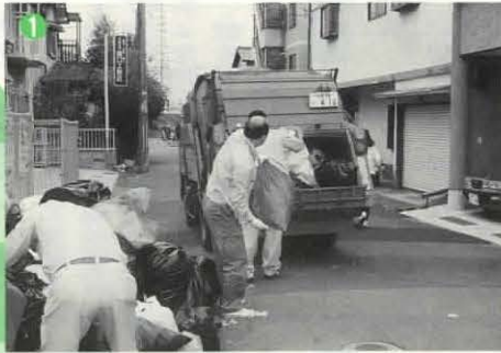
①燃えるごみ収集ステーションでの作業