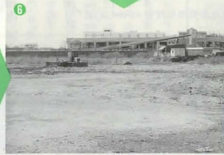
⑥勝勝寺埋立地。約15年後には、ここがいっぱいになるかも…

わたしたちの暮らしは、大量に作られた製品を消費することにより成り立っています。その暮らしの中で生み出される「ごみ」問題は避けては通れないものの一つです。グラフでもわかるように、分別収集を開始した昭和53年度から平成6年度までを見て、確実にごみは増え続けています。かつては、限られたものを大切に使い、なるべく捨てないようにして「生かして使う、直して使う」という習慣がありました。しかし今では、わたしたちの周りにはものがあふれ、次から次へと新製品が作り出されています。一方、使い捨て・大量消費が地球環境に深刻な影響を与えているという危機感から、現在は、リサイクルの時代だといわれています。