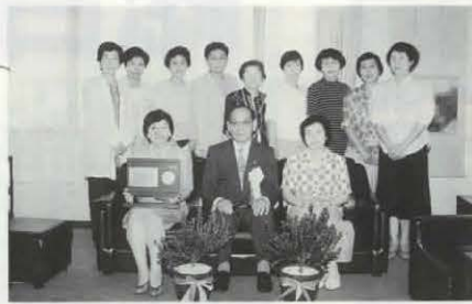
おとくにエルダーケア ボランティアの会