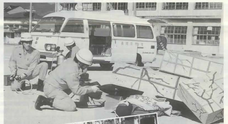
(前回の総合防災訓練から) ▲救助・救急訓練 ▲地域住民の避難訓練

都市直下型地震として大きな被害を出した阪神・淡路大震災。倒壊建物からの救出・初期消火・避難所への救援・給水やライフラインの確保など、初動体制の重要さが指摘されています。来たる9月3日(火)、京都府との共催により、都市直下型地震を想定した総合防災訓練を行います。