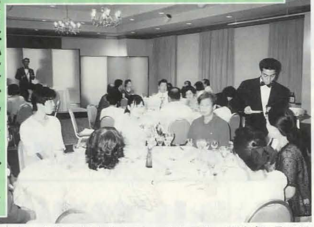
▲会員を対象に行われたテーブルマナー教室(7月28日 ホテル日航プリンセス京都で)