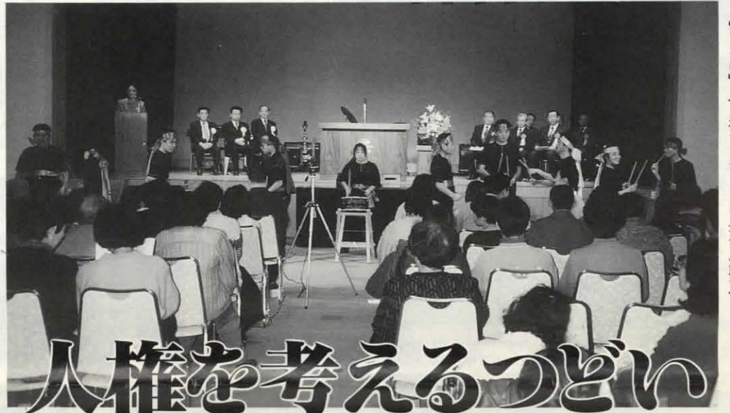
▲昨年の「人権を考えるつどい・障害児者の人権を考える市民のひろば」(7年12月10日、中央公民館で)

わたしたちは普段、人権について特に意識するという事はあまりありません。自分には直接関係ないと思っている人もいるかもしれません。しかし、セクハラやいじめなど、わたしたちのまわりには様々な人権問題があります。知らず知らずのうちに人を差別したり、差別されたりすることが、日常生活の中で起こり、社会の制度の中で続いています。人権を守り、守られる社会を実現するために、人権週間を機に、改めて考えて見ませんか。