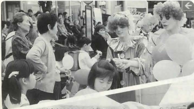
◀子どもたちに風船をプレゼント。ピエロは大忙し