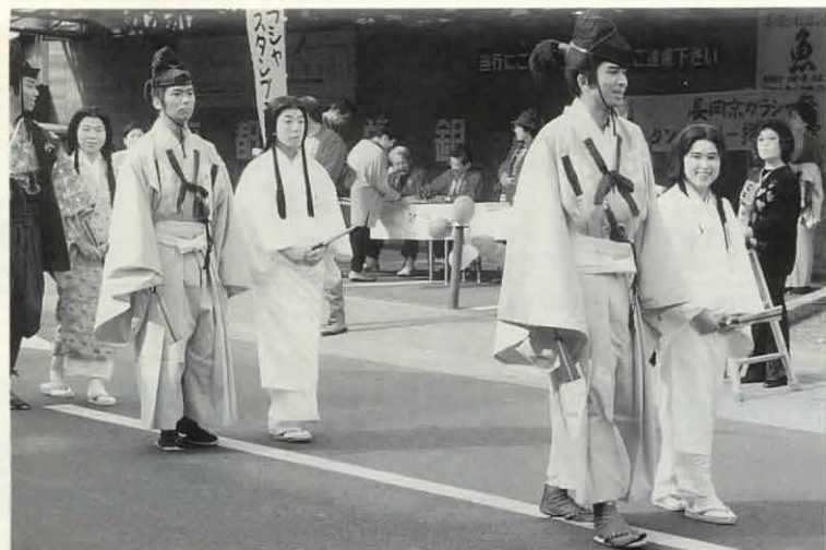
▲エンゲージカップルには、浴道から「おめでとう」の声も ※ガラシャ祭のスナップ写真が実行委員会事務局(総務課自治振興係内)に備えてあります。お気軽にご利用ください。