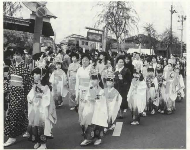
◀勝竜寺城公園に到着/最後まで頑張ったね