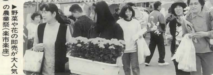
▶野菜や花の即売が大人気の農業祭(楽市楽座)