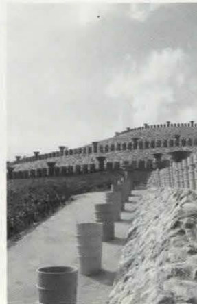
▲私市円山古墳(綾部市)