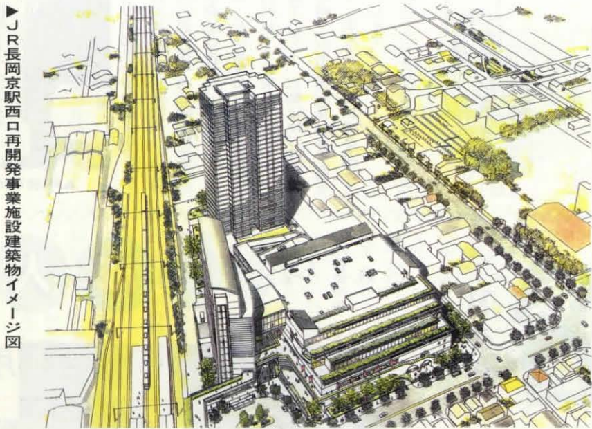
▶JR長岡京駅西口再開発事業施設建築物イメージ図

JR長岡京駅西口地区市街地再開発事業は、二十一世紀に向けた本市の新しいまちづくりの第一歩となります。個性豊かなまちの顔づくりとして、駅前広場や道路整備と同時に、地域の新たな交流拠点となる施設建築物との一体的な整備を図る予定です。 平成4年11月に市と地元により準備組合が設立され、「自分たちの街は自分たちでつくろ」という考えを基に、様々な調整や検討を繰り返しながら、昨年5月、地元案として「都市計画原案」が作成されました。 市では、この地元原案をもとに、市議会での議論や、市民のみなさんからのご意見ご提言を参考とし、関係機関との協議・指導を受けながら、精査・検討を重ね「都市計画決定の市原案」を作成しました。