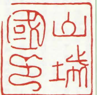
山城国印(延暦23年) 『国史大辞典』第1巻 別刷図版「印章」より (吉川弘文館刊)

長岡京が廃され、桓武天皇が平安京へ移ったのは延暦十三(七九四)年10月です。これにより10年間の政治都市は機能を停止し、もとの田園地帯へと戻ってしまいました。史料によると、旧長岡京内の土地は貴族や官人、国の機関に払い下げられており、その大半は農地へ転用されたと考えられています。 しかし、3年後の延暦十六(七九七)年には山城国府(国の役所)が葛野郡(京都市右京区)から長岡京の南へ移転しています。これを初めて置かれた国府から数えて三度目の移転であることから第三次山城国府と呼んでいます。このように、平安前期の旧長岡京には田園風景のなかに、国府や寺院、離宮などの殿舎が営まれたことがわかります。 では、史料に記された長岡京の南に移転した国府はどこに存在したのでしょうか。これまで考古学サイドから提示された推定地には、大山崎町の百々遺跡、向日市の中福知遺跡、長岡京市の南栗ヶ塚遺跡などがありますが、まだ決定的な資料に乏しく結論を得るまでには至っていません。このように、国府所在地が複数の遺跡に想定される理由は、中枢施設である政府が未確認であり、周辺に造営された施設についても、地方支配の拠点である国の役所か、寺院や王臣・貴族の離宮、あるいは豪族居宅に属するものか断定する要素がまだ十分でないためと考えられます。 近年は、開田から神足の段丘部にかけて役人や貴族の暮らしを物語る平安時代前期の遺跡が発見されていますが、まだ全体像については明らかではありません。 地方官衙(国や郡などの役所)の研究は、これまで文献史学と歴史地理学を中心に進められてきましたが、近年は考古資料との総合的な検討が欠かせなくなっています。それぞれの立場から提示される条件を検証することにより、廃都後の遺跡の評価がより確かなものになると考えられます。