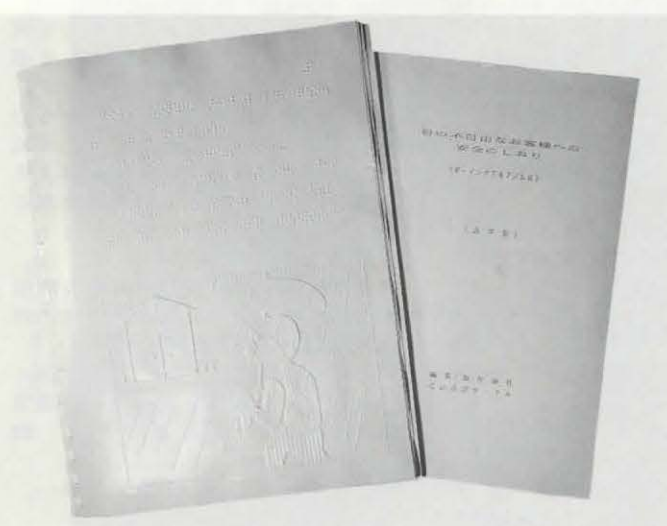
▲漫画の点訳化第2弾の「コボちゃん」(左)と「航空機安全のしおり」(右)

市では、障害者福祉の充実を目指した、長岡京市障害者福祉計画づくりを進めています。そのために昨年7月、障害者計画推進委員会を発足させました。現在、障害者に行ったアンケートを集計するなど策定に向けて作業を進めています。ボランティア活動の支援も含めた市障害者福祉計画は来年度中に策定されます。