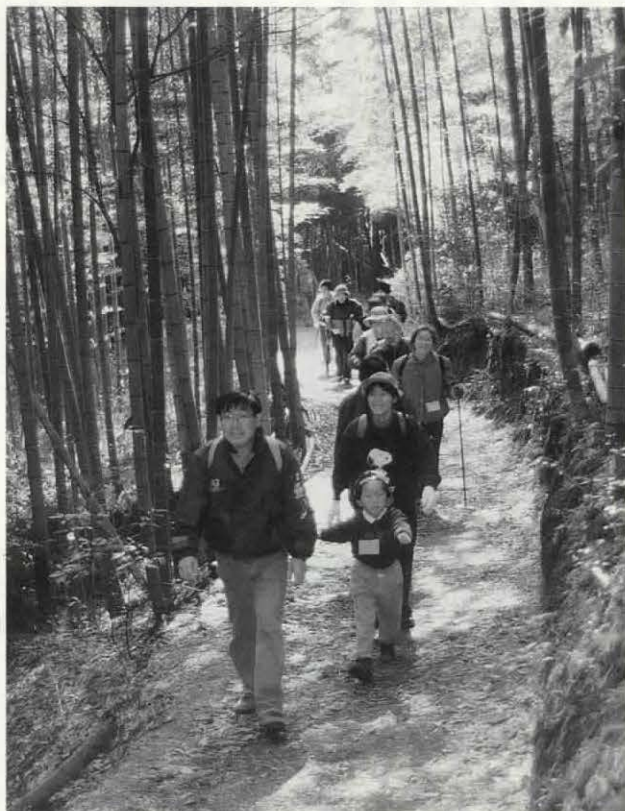
▶約二百三十人が楽しんだ「早春の西山を歩こう会」(3月2日)