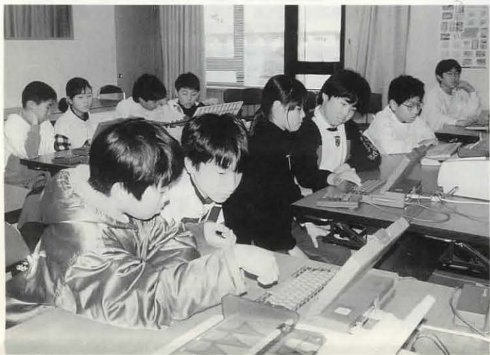
▲ゲームなどを楽しみながらパソコンの機能や使い方を学んだ「小学生のためのパソコン教室」(3月1日)