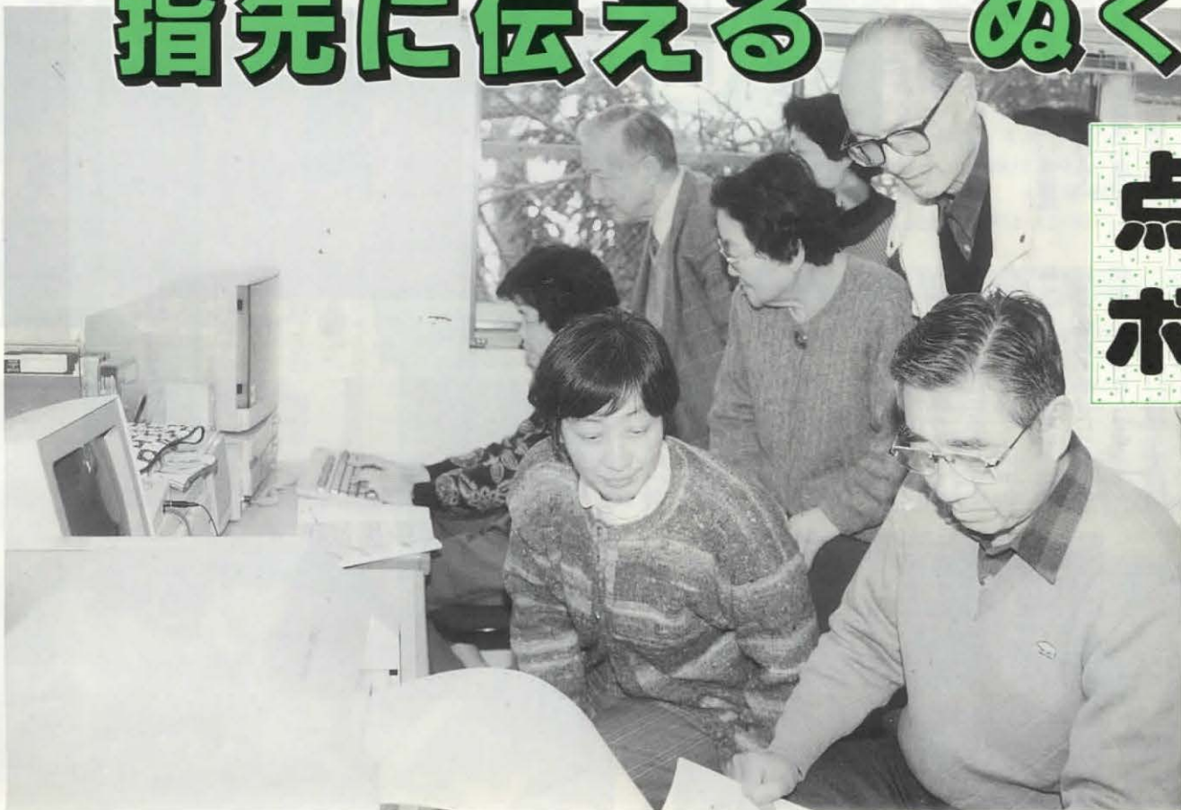
▶パソコンを使って研修する会員ら

駅のプラットフォーム近辺や券売機のボタンの上には、必ずといっていいほど点字ブロックが設置してあったり、点字の表示があったりします。何げなく見過ごしてしまいがちですが、視覚障害者にとっては、貴重な情報源でもあります。この大切な情報源をボランティアとして視覚障害者に提供しているのが、「乙訓点訳サークル」です。今回は乙訓点訳サークルの活動を紹介します。