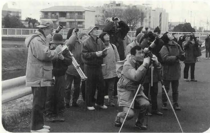
▲約30人が参加した「冬の小畑川バードウォッチング」(2月23日)