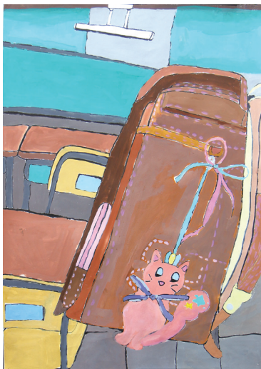
「わたしのお気に入り」

工夫したところは、真珠の花が光っている風に見せるために、黄色やオレンジ色をチョンチョンとまわりにつけたことです。