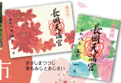
きりしまつつじ 青もみじとあじさい