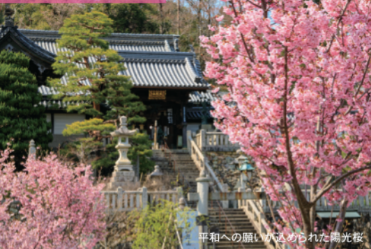
平和への願いが込められた陽光桜