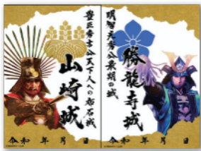
山崎城・勝竜寺城 合体御城印2026 2月2日~販売中