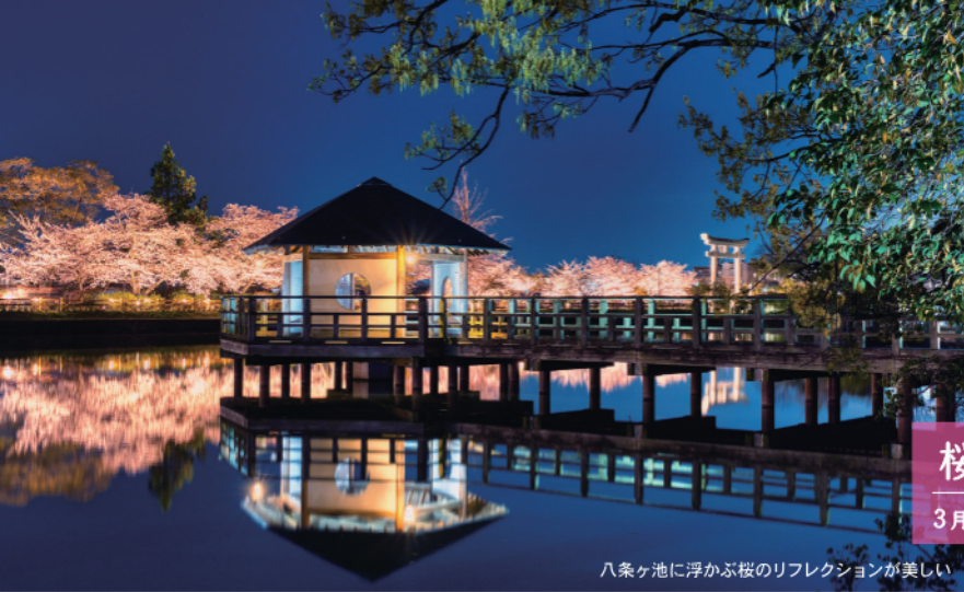
八条ヶ池に浮かぶ桜のリフレクションが美しい