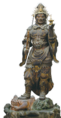
幽愁の毘沙門天立像

日時: 4月4日(土)~5月6日(水・休)の土日祝 拝観料: 1,000円(解説ブックレット付) 時間: 9時30分~16時(最終受付15時45分)