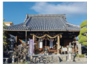
勝竜寺城公園から南へ徒歩5分の所にある空海開基のぼけ封じ観音霊場「勝龍寺」