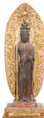
最古の一日造立仏 十一面観音立像