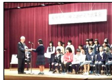
人権問題研究市民集会