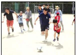
みんなのスポーツデー