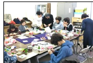
地域の生涯学習活動