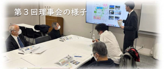
第3回理事会の様子