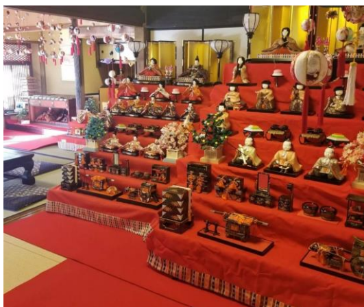
神足ふれあい町家「ふれあいひなまつり」