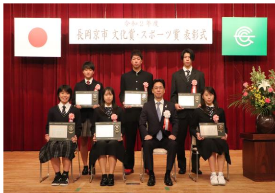
文化賞・スポーツ賞表彰式 (中央公民館)