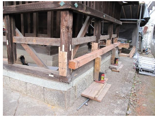
春日神社本殿覆屋保存修理検査風景（令和2年度）