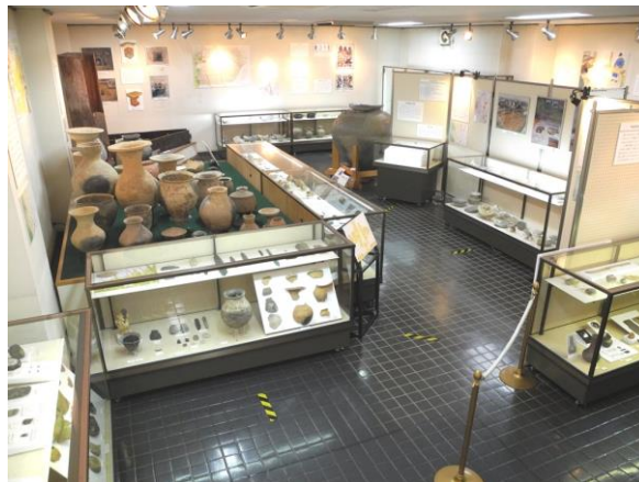
埋蔵文化財調査センター 特別企画展