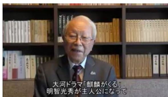
大河ドラマ活用推進事業（令和2年度）