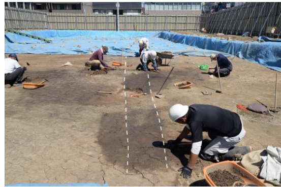
市役所庁舎前の発掘現場（令和2年6月）