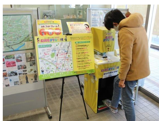
「ようこそ！まちなか博」実施事業（令和2年度）