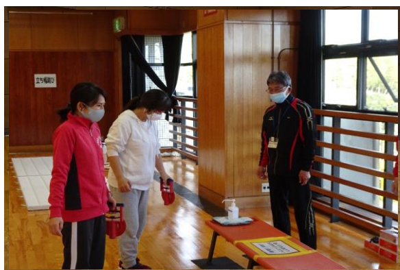
市民スポーツフェスティバル (西山公園体育館)