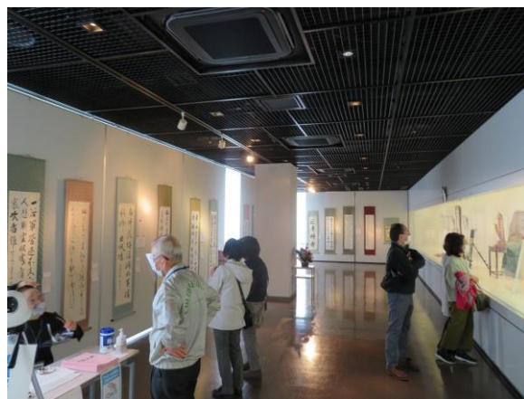
令和2年度 長岡京展