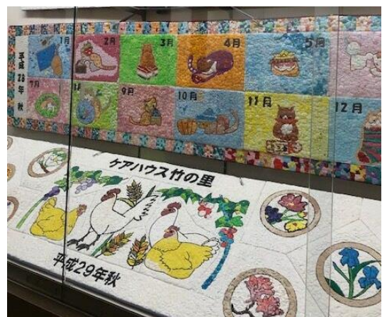
神足ふれあい町家「ギャラリーMACHIYA」