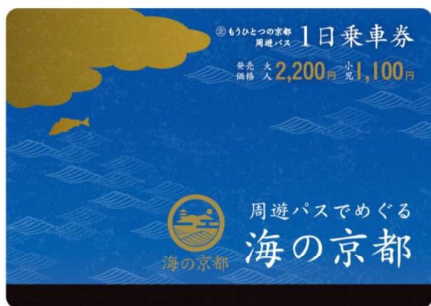
もうひとつの京都 周遊パス 海の京都エリア（1日乗車券）券面