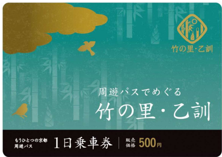
もうひとつの京都 周遊パス 竹の里・乙訓エリア 券面