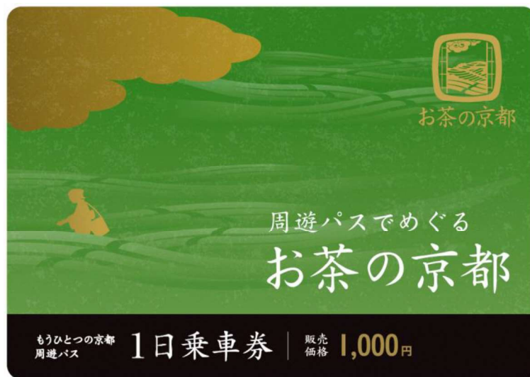
もうひとつの京都 周遊パス お茶の京都エリア 券面

①、②いずれも、観戦チケット・チラシ（スタンプ印付き）1枚につき、周遊パス1枚までご購入いただけます。