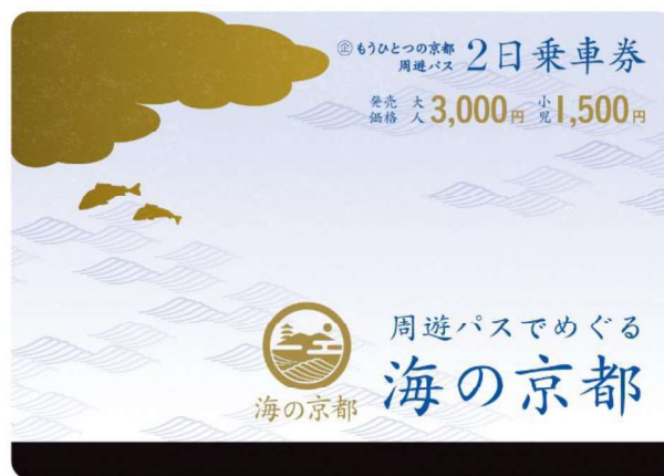
もうひとつの京都 周遊パス 海の京都エリア（2日乗車券）券面