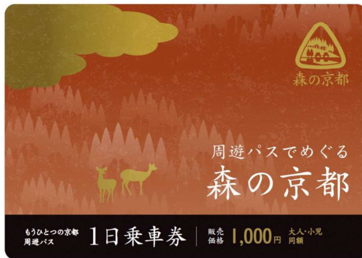
もうひとつの京都 周遊パス 森の京都エリア 券面