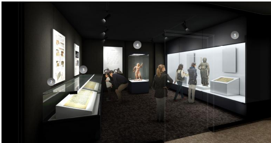
展示室OPEN 特別企画展

春や秋などに開催する企画展示。12/19～OPEN特別展スタート ※開館時間は文化財保護の観点から制約あり