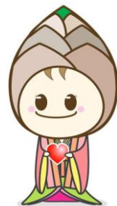
ながおかきょうし じんげん 長岡京市の人権マスコット 「たけとん」