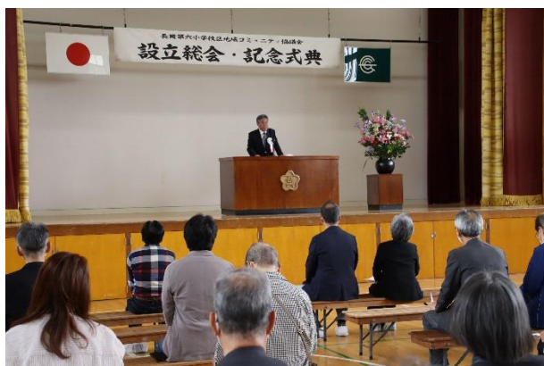
奥本会長のご挨拶の様子