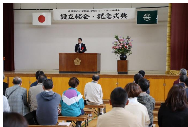
中小路市長のご挨拶の様子