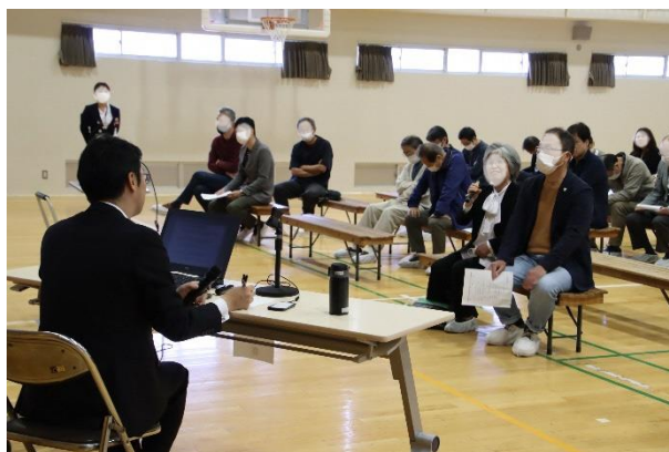
熱心に市長に質問されていました