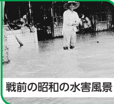
戦前の昭和の水害風景

問(議員) 過去の台風では、神足小学校の築山の石垣まで、さらに校門前の旧長岡町役場辺りも一面が水浸しであったことが市史に残されている。また、その後の犬川の整備後も床下浸水があり、不安な環境は見逃せない。御陵山崎線と神足奥海印寺線の施工時に整備する雨水貯留施設について、機能と効果はどのようなものか。 答(市側) 10年に一度の降雨量61・1ミリメートルを条件とした場合、神足ポンプ場の放流先である犬川の最大可能流量から計算すると、流入量と放流量に1・4立方メートルの差が生じる。この差については、京都府施工の御陵山崎線の道路拡幅工事箇所地下に、雨水を一旦貯留する貯留槽を整備する計画を進めている。また、ポンプ場の改修工事も予定しており、これらの整備により10年に一度の降雨量に対応が可能となる。