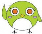
“環境の都”長岡京 PRキャラクター 「ミヤコ」ちゃん