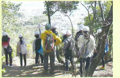
森の出前授業による環境学習

皆さんからいただいた「緑の募金」は、地球温暖化や災害防止、水源の涵養、生物多様性の保全などを目指した森林づくりや緑化運動、未来を担う子ども達の「緑の少年団」活動、学校緑化や森林環境教育、緑を大切にする心を育てるポスターコンクールの開催などのために使われています。