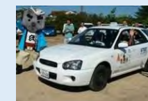
自家用有償旅客運送