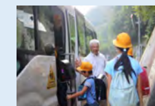
福祉輸送、スクールバス、病院・商業施設等の送迎サービスなど