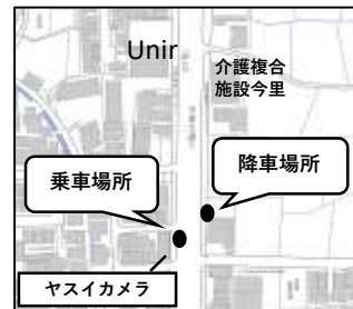
今里バス停付近 ヤスイカメラ前・向い