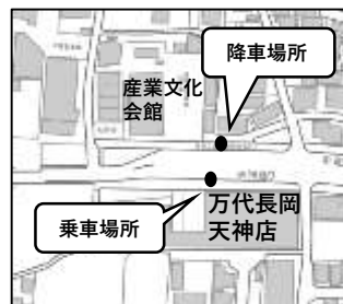
阪急長岡天神駅（南東） 万代長岡天神店前・向い