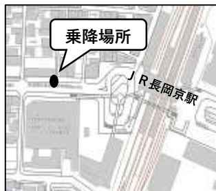
JR長岡京駅（西口） さつき整骨院前