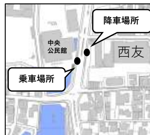
文化センター前バス停付近 中央公民館前・向い