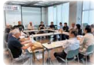
◀令和7年度 バンビオ1番館での開催の様子