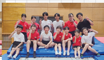
▲中には10年以上続けるクラブ生もいるそうです