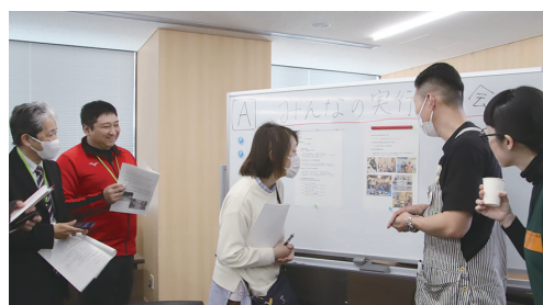
前回の発表会 & 交流会の様子