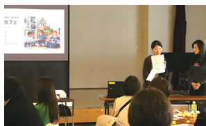
前回のプレゼン大会の様子