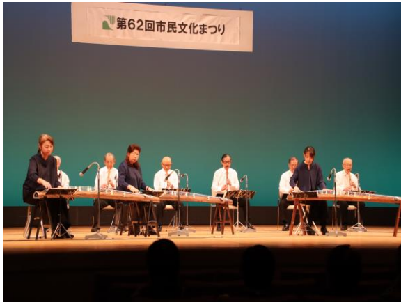
第 62 回市民文化まつり