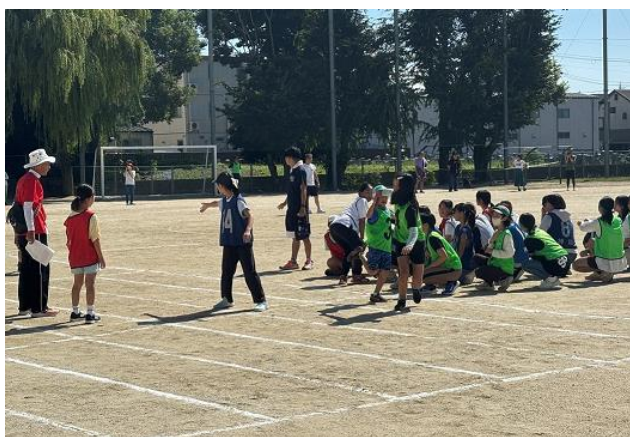
第60回市民大運動会 (神足小学校)