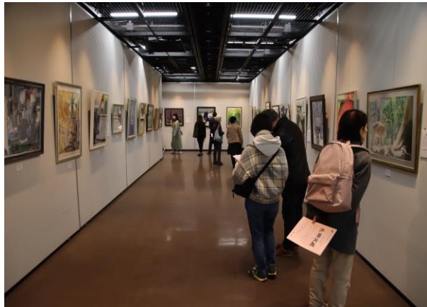
第 33 回長岡京展