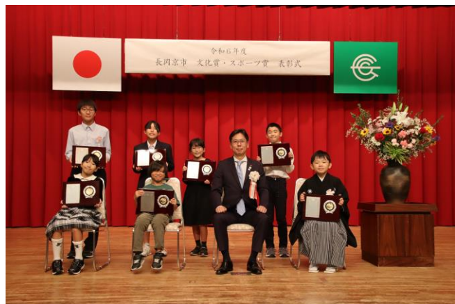
文化賞・スポーツ賞表彰式 (中央公民館)