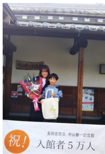
中山修一記念館 来場者5万人記念式典