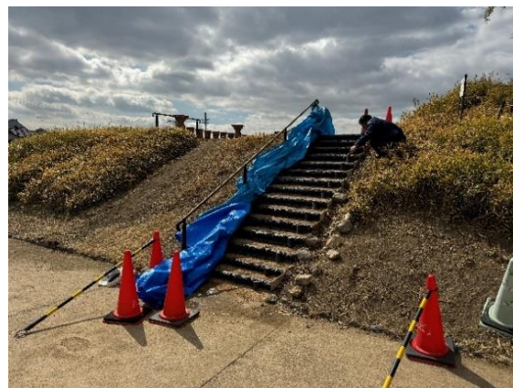
恵解山古墳の階段設置工事の様子（左：設置前 右：設置後）