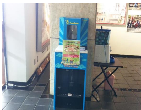
歴史文化めぐる。総合活用事業 恵解山古墳公園開園10周年記念イベント「いげのやまフェスタ」と「タケノコ食えストスタンプラリー」の様子（令和6年度）