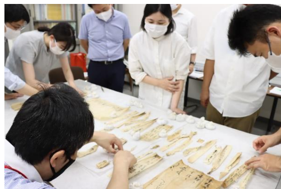
乙訓寺木造十一面観音立像像内納入品保存修理（令和6年度）