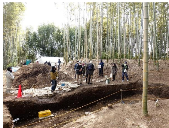
令和6年度現地説明会（井ノ内稲荷塚古墳）