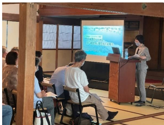
長岡京市文化財保存活用地域計画講演会「『名所図会』にみる江戸時代の長岡京市と光明寺」（令和6年度）