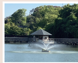
噴水が上がると ちょっとワクワクします。

八条ヶ池は、寛永15(1638)年に作られたそうで、今年で388年! いつか息子も大人になり、八条ヶ池を散歩し、今度は息子が通りかかった赤ちゃんにほほえみかける。そんな平和な未来が続きますように。