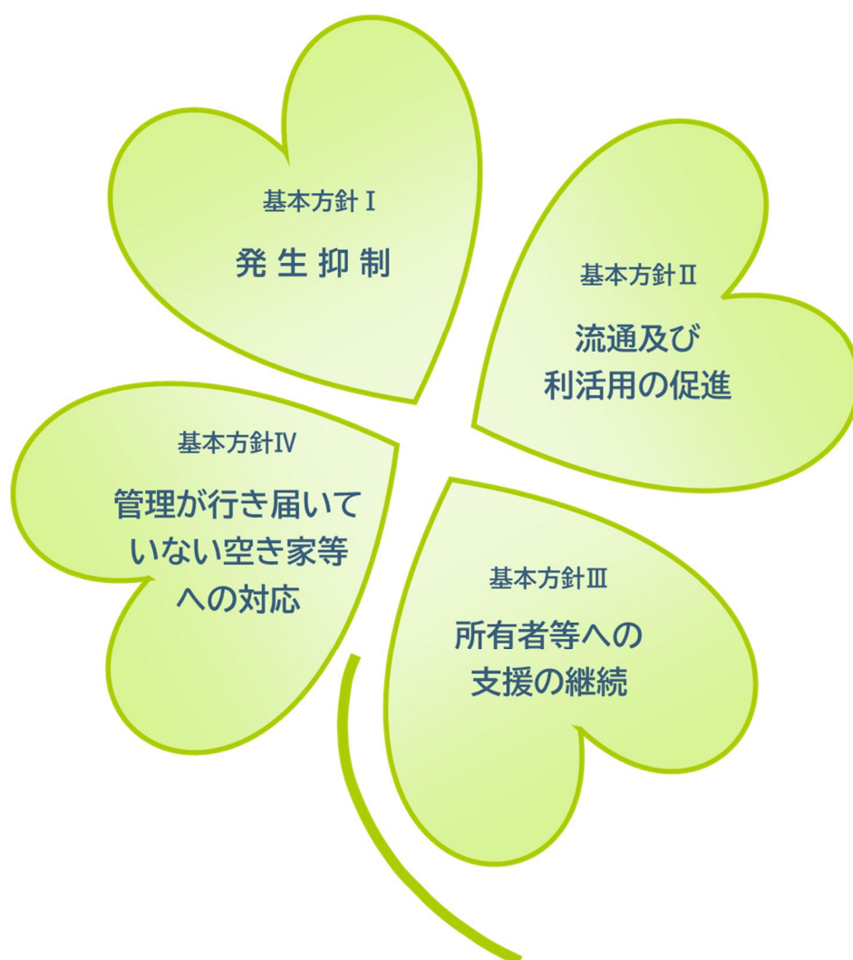
図 4-1_基本方針のイメージ

そして、特措法及び条例に基づき、空き家所有者へ適切な管理を促すことで生活環境の保全を図り、市民の安全・安心を確保し、多くの人に住みたい・住みつづけたいと思われるまちを目指していきます。