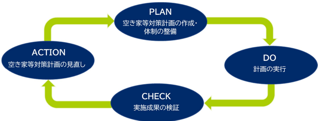
図 6-2_計画の見直し(進行管理)

次回の検証及び見直しは、令和12年度に行う予定ですが、本計画の進行について定期的に長岡京市空き家等対策協議会に報告し、検証を行い、必要に応じて計画の見直しを行います。