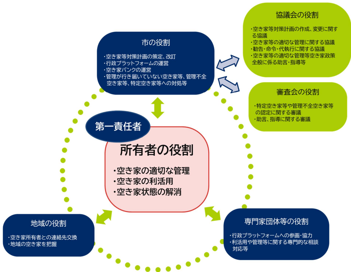
図 6-1 協働のイメージ

空き家対策を推進するためには、所有者等だけでなく事業者や市民の協力による対応が不可欠です。そのため、所有者、市、地域、関係団体等はそれぞれの役割を理解し、相互に連携、協力して空き家対策に取り組む必要があります。